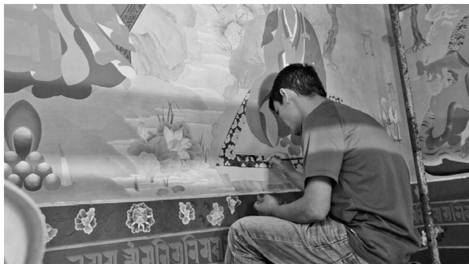
Un artiste en train de peindre un détail de la fresque

D'avril à septembre, le grand temple a été le théâtre de la réalisation d'une fresque évoquant les 16 Arhats* sur les murs de l'entrée. Lama Samten nous en parle :