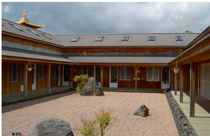
Ermitage Pendé Ling

Dhagpo Kundreul Ling, en Auvergne, est un lieu de pratique et de vie où hommes et femmes ont pour vocation de préserver et transmettre l'enseignement du Bouddha. Il regroupe deux ermitages monastiques, dix centres de retraite de 3 ans. De plus, de courtes retraites individuelles ou de groupe sont proposées à l'ermitage Pendé Ling.