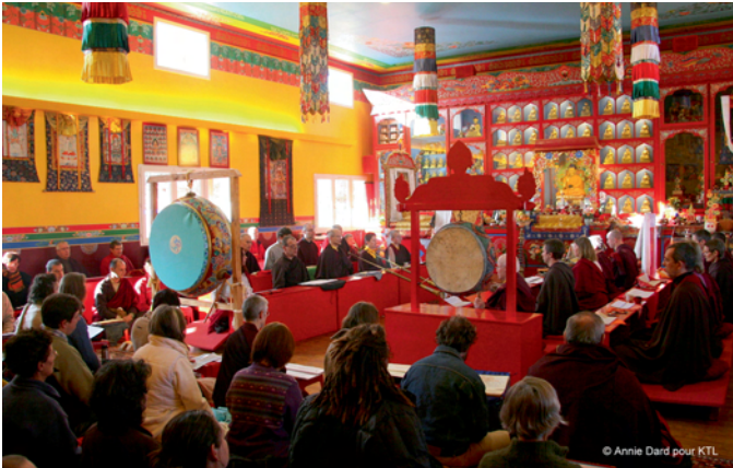
Temple de Laussedat