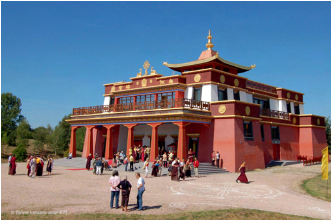
Le Grand temple

Ermitage monastique et centres de retraite bouddhiques sous l'autorité spirituelle du 17 e Gyalwa Karmapa Trinley Thayé Dorjé